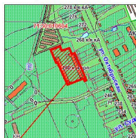
Территория проекта межевания